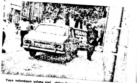
Yaya vatandaşın yolunu özel otolar kapamakta. Vatandaş geçmek için mecburen asfalta inmekte ve dikkatsiz bir şoförün tekerleri altında

şahane yaşantıyı sağlayabiliyorsa herhalde çok marifetli biri olsa gerekir. Şayet bu lüks başka yollardan sağlanıyorsa, o takdirde Hürriyet'e