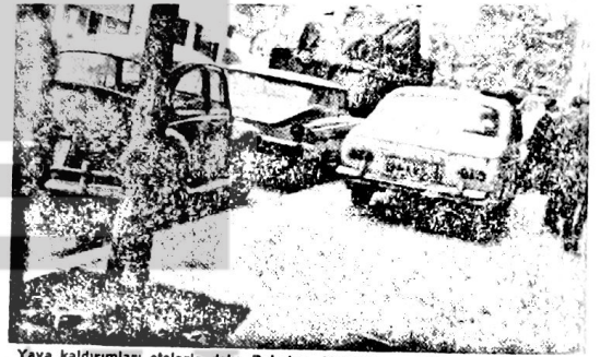
Yaya kaldırımları otolarla dolu. Bakalım, Vatandaş aralıktan geçebilecek mi?

beklemenin yanında; tretuvarlar «hususi» otolarla kapatılmakta vatandaşın yolu adeta